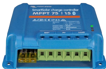
Contrôleur de charge SmartSolar MPPT 75/15