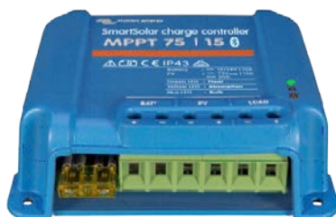
Contrôleur de charge SmartSolar MPPT 75/15