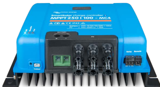
Contrôleur de charge solaire MPPT 250/100 MC4 sans écran