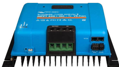
Contrôleur de charge SmartSolar MPPT 250/100-Tr VE.Can sans écran