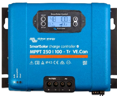
Contrôleur de charge SmartSolar MPPT 250/100-Tr VE.Can avec écran à brancher en option