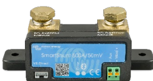
Détection Bluetooth: SmartShunt