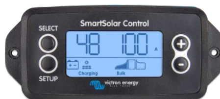
Écran à brancher SmartSolar