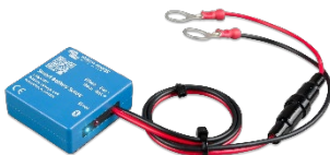
Détection Bluetooth : Sonde Smart Battery Sense