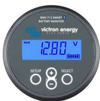
Détection Bluetooth : Contrôleur de batterie BMV-712 Smart