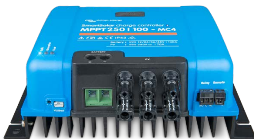
Contrôleur de charge solaire MPPT 250/100 MC4 sans écran