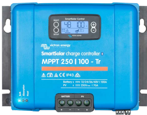
Contrôleur de charge solaire MPPT 250/100-Tr avec un écran enfichable