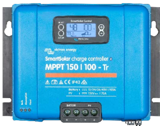
Contrôleur de charge solaire MPPT 150/100-Tr avec un écran enfichable