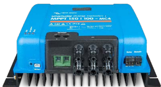
Contrôleur de charge solaire MPPT 150/100 MC4 sans écran