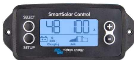
Écran à brancher SmartSolar

Retirez simplement le joint en caoutchouc qui protège la prise sur le devant du contrôleur puis insérez l'écran.