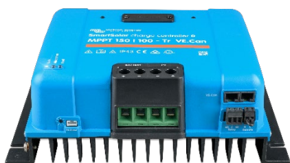
Contrôleur de charge SmartSolar MPPT 150/100-Tr VE.CAN sans écran