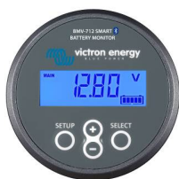
Détection Bluetooth Contrôleur de batterie BMV-712 Smart