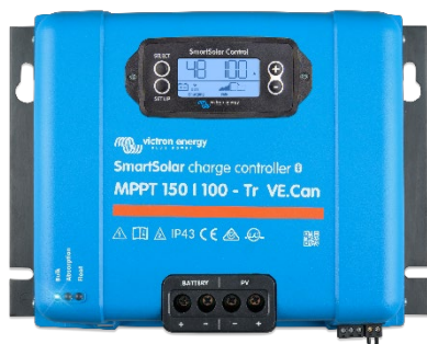
Contrôleur de charge SmartSolar MPPT 150/100-Tr VE.Can avec écran à brancher en option