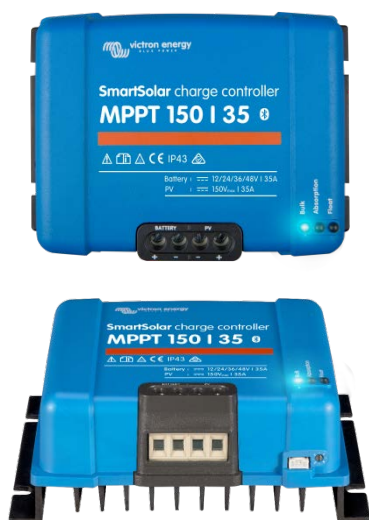
Contrôleur de charge SmartSolar MPPT 150/35