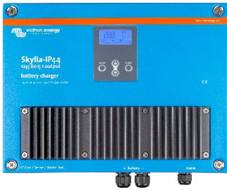
Skylla-IP44 12/60 (1+1)

12 V/60 A et 24 V/30 A, plage de tension d'entrée 90-265 V