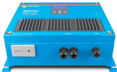
Skylla-IP44 12/60 (1+1)

Pour de plus amples informations sur les batteries et leurs méthodes de charge, vous pouvez consulter notre livre « L'Énergie Sans Limites » (disponible gratuitement chez Victron Energy et téléchargeable sur www.victronenergy.com ).