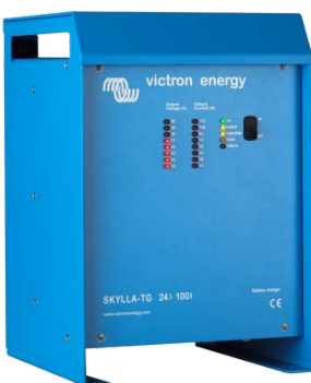
Skylla TG 24 100