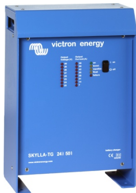
Chargeur Skylla 24 V 50 A