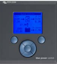
Tableau de commande Blue Power

Une solution pratique et bon marché pour une surveillance à distance, avec un bouton rotatif pour configurer les niveaux de PowerControl et PowerAssist.