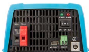
Phoenix 12/375 VE.Direct