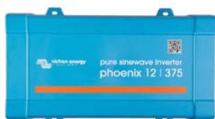
Phoenix 12/375 VE.Direct