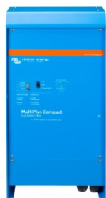
MultiPlus Compact 12/2000/80

Si des systèmes disposant d'un tableau de commande Color Control sont connectés par Ethernet, il est possible d'y accéder et de modifier leur configuration.