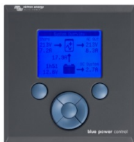
Tableau de commande Blue Power

Une solution pratique et bon marché pour une surveillance à distance, avec un bouton rotatif pour configurer les niveaux de Power Control et Power Assist.