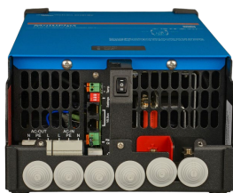
MultiPlus 2 000 VA (sans couvercle inférieur)