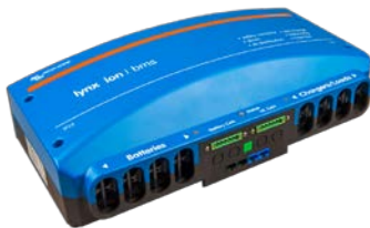
BMS Lynx-ion 1000 A