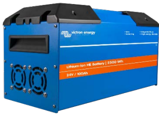
Batterie HE 24 V/100 Ah