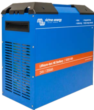
Batterie HE 24 V/200 Ah