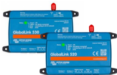
GlobalLink 530 et 520