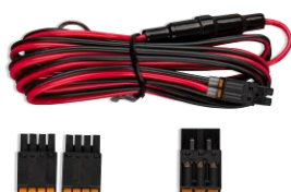
Accessoires inclus avec le GlobalLink 520 et 530