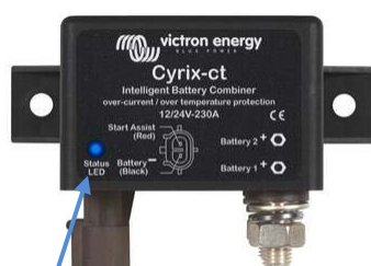
LED indicateur d'état