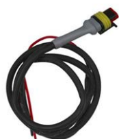
Câble de contrôle pour Cyrix-ct 12/24-230 Longueur : 1 m