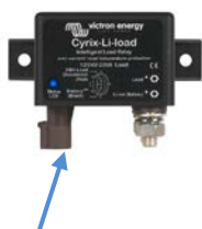
Voyant d'état LED