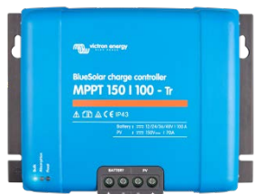
Contrôleur de charge solaire MPPT 150/100-Tr