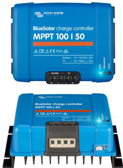
Contrôleur de charge solaire MPPT 100/50