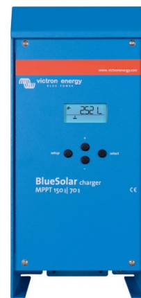
150/70 & 150/85 CAN-bus