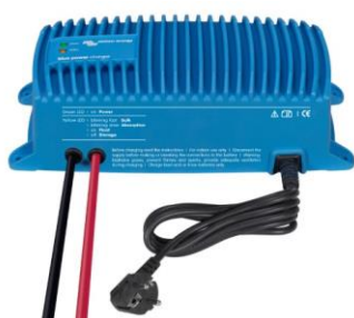
Chargeur Blue Smart IP67 12/25