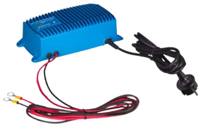
Chargeur Blue Smart IP67 12/25