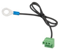
Connecteur avec un câble négatif CC préassemblé (inclus)

Le BatteryProtect protège la batterie en la déconnectant des charges non essentielles avant qu'elle ne soit complètement déchargée (ce qui l'endommagerait) ou avant qu'il ne lui reste pas suffisamment de puissance pour lancer le moteur.