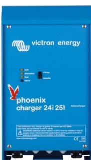
Chargeur 24 V 25 A