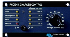
Tableau Charger Control'

Alarme visuelle et sonore en cas de tension batterie trop haute ou trop basse. Seuils de déclenchement réglables. Contact sec pour signalisation déportée.