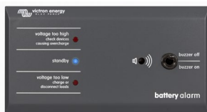
Tableau 'Battery Alarm'

Alarme visuelle et sonore en cas de tension batterie trop haute ou trop basse. Seuils de déclenchement réglables. Contact sec pour signalisation déportée.