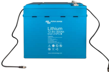
Batterie LiFePO4 12,8 V 300 Ah

Fonction très utile pour localiser un (éventuel) problème, comme un déséquilibre sur les cellules par exemple.