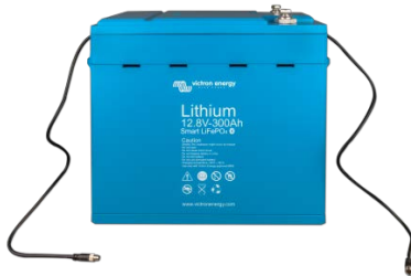
Batterie LiFePO4 12,8 V 300 Ah

Fonction très utile pour localiser un (éventuel) problème, comme un déséquilibre sur les cellules par exemple.