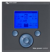
Tableau de commande Blue Power

Une solution pratique et bon marché pour une surveillance à distance, avec un bouton rotatif pour configurer les niveaux de Power Control et Power Assist.