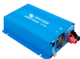
Phoenix Inverter 12/750

En mode économie d'énergie, le courant sans charge est réduit à 1/3 du courant nominal. Dans ce mode, le convertisseur est arrêté dans le cas d'une absence de charge ou d'une charge très faible, puis mis en marche toutes les deux secondes pour une courte période. Si le courant de charge dépasse le niveau défini, le convertisseur continue à fonctionner. Dans le cas contraire, le convertisseur s'arrête à nouveau. Le niveau marche/arrêt peut être configuré entre 15 W et 80 W via des interrupteurs DIP.