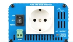
Phoenix Inverter 12/180 with Schuko socket