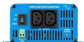
Phoenix Inverter 12/350 with IEC-320 sockets