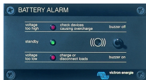
Tableau 'Battery Alarm'

Alarme visuelle et sonore en cas de tension batterie trop haute ou trop basse. Seuils de déclenchement réglables. Contact sec pour signalisation déportée.