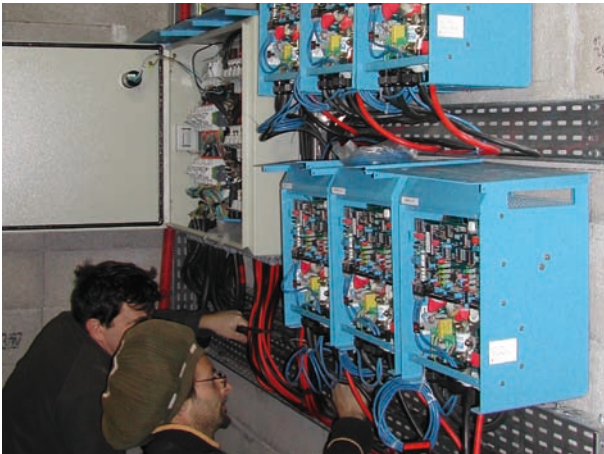
Derniers travaux de raccordement